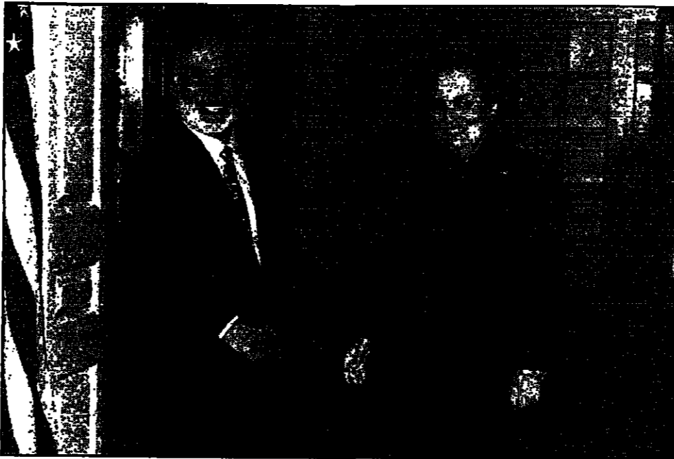
وزير الخارجية الأمريكية ترحب بالعمال الأردني في واشنطن أمس

الاسرائيلي في حزيران (يونيو) 1967. وقد أصبح كلينتون ثاني رئيس امريكي يعود الى تمييز الدبلوماسية الهادئة. وقال ماكوري بان الرئيس كلينتون رغب في القيام بخطوات هامة والتدخل شخصيا لكنه اضطر الى ان يترك الرئيس كلينتون الى يريده في الوقت الراهن تقديم تفاصيل حول طريقة قيامه بذلك في الوقت الذي تستمر الولايات المتحدة باجراء مشاورات مع الاطراف وهي منخرطة في حوار نشط في المنطقة ومع الاطراف انفسهم. وقول معلقون ان نقوي ما قاله ماكوري هو ان يترك الرئيس كلينتون محسوبا بما تولاه الاطراف وما كانت التسوية فان خطوات كلينتون ستكون باتجاه اسرائيل فقط. وفي الوقت الذي قال فيه الملك حسين بعد محادثاته مع كلينتون انه متشجع فانه اضاف جان على واشتن والقيام بجهود اكبر كعربا عندما اذا كان لماواضات السلام ان تستأنف وتسفر عن نتائج. وقال العمال الاربعة للتفاوض في الولايات المتحدة للتفاوض مع اسرائيل في وقت سابق من الشهر الماضي. وقال ماكوري ان هذا هو الوقت الذي قال فيه الملك حسين ان الولايات المتحدة للتفاوض مع اسرائيل في وقت سابق من الشهر الماضي. وقال ماكوري ان هذا هو الوقت الذي قال فيه الملك حسين ان الولايات المتحدة للتفاوض مع اسرائيل في وقت سابق من الشهر الماضي.